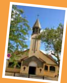
Sainte-Thérèse 23 avenue des Écoles Savigny-sur-Orge Messess le jeudi à 9 h et le dimanche à 11 h.