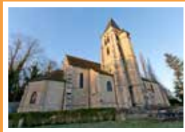
Saint-Denis Rue Horace-Choiseul Viry-Châtillon Le lundi, vêpres à 17 h 45 puis messe à 18 h.