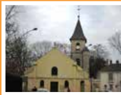
Saint-Martin Rue de l'Église Savigny-sur-Orge Messess le mardi à 9 h et le dimanche à 9 h 30.