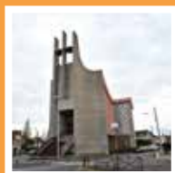
Saint-Esprit 53 boulevard Guynemer Viry-Châtillon Messe le dimanche à 11 h.