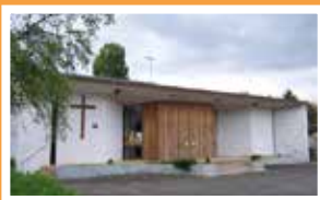
Notre-Dame des Cités 18 avenue de Marseille Viry-Châtillon Messess le vendredi à 18 h, le samedi à 18 h et le dimanche à 10 h (messe tridentine en latin).