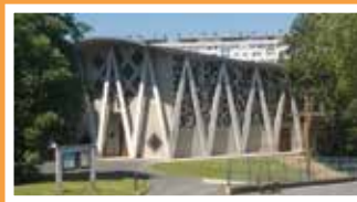
Notre-Dame d'Espérance 2 rue Renoir Savigny-sur-Orge Messe le samedi à 18 h, messe anticipée du dimanche.