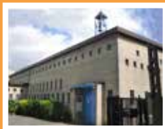
Sainte-Bernadette 16 avenue Robert-Keller Viry-Châtillon Messess le mercredi à 18 h et le dimanche à 9 h 30.