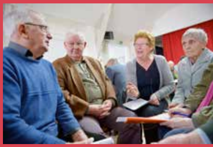
Cofinme Mercier / Cric