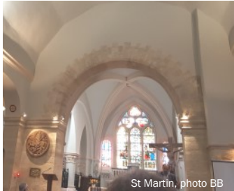
St Martin

Ces salles sont très utilisées et parfois soumises à rude épreuve : veillons à ce qu'elles restent belles et propres pour le plaisir de tous , et ne compliquons pas la tâche des «petites mains» bénévoles indispensables qui réparent, rangent, nettoient, jardinent, sortent et rentrent les poubelles (et oui aussi!) ... B.