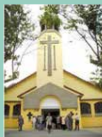
Sainte-Thérèse, 23 avenue des Écoles, Savigny-sur-Orge.