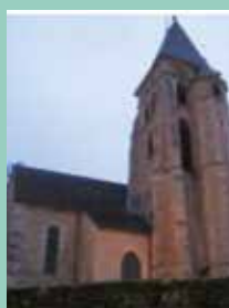
Saint-Denis, Rue Horace-Choiseul, Viry-Châtillon