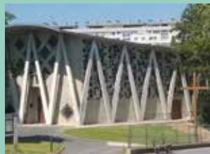
Notre-Dame d'Espérance, 2 rue Renoir, Savigny-sur-Orge.