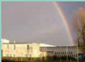
Sainte-Bernadette, 16 avenue Robert-Keller, Viry-Châtillon.