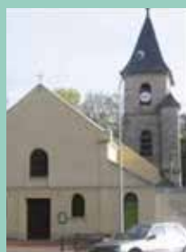
Saint-Martin, Rue de l'Église, Savigny-sur-Orge.