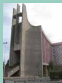
Saint-Esprit, 53 boulevard Guynemer, Viry-Châtillon.