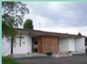
Notre-Dame des Cités, 18 avenue de Marseille, Viry-Châtillon.