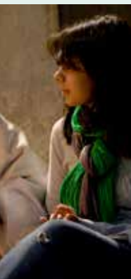
Corinne Mercier / CIRC