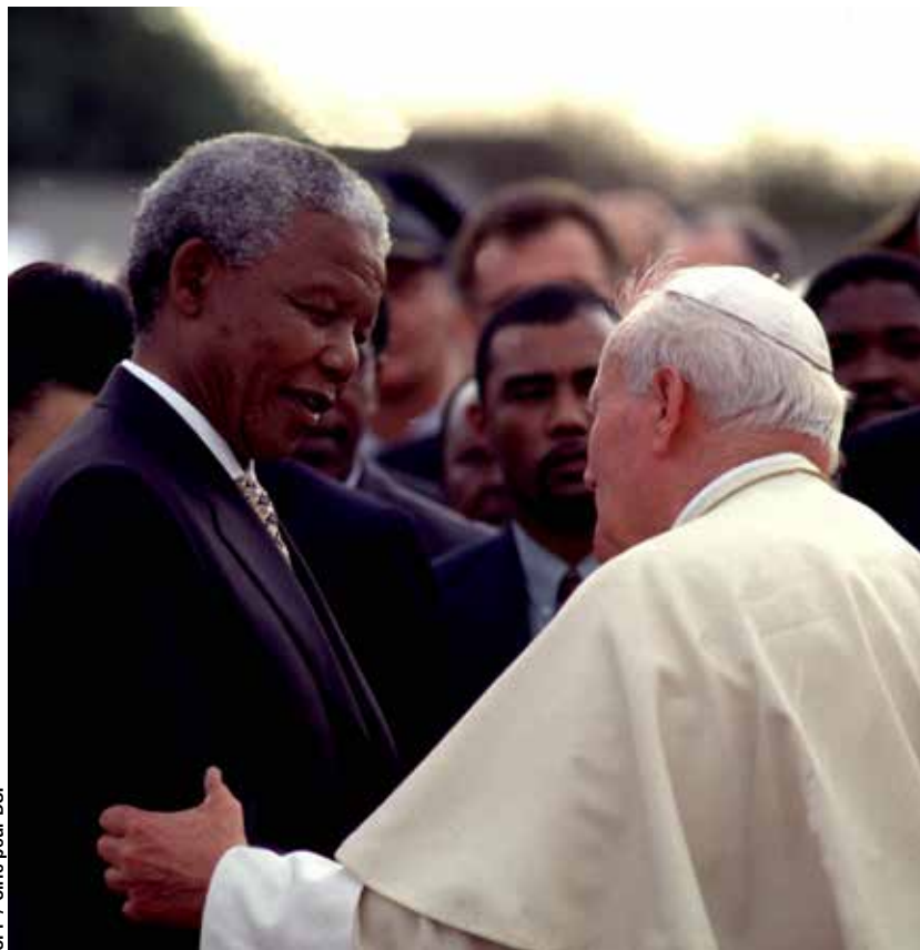
1995 à Johannesburg, Afrique du Sud. Deux grands artisans de paix se rencontrent : Nelson Mandela et Jean-Paul II.

L'histoire récente a vu se lever des héros et des hérauts de la paix entre les peuples, entre les nations, au sein des structures religieuses,