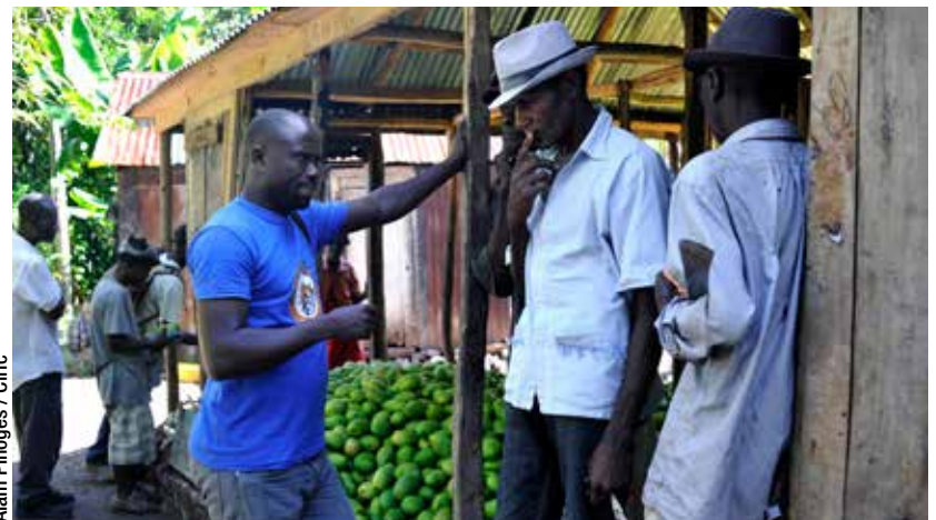
Alain Pinoges / Ciric